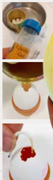
Gjuta ljus i äggskal

Placera blommorna i en glasburk. Limma fast strömbrytaren på lämpligt ställe. Pynta glasburken.