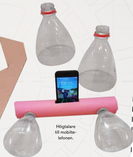
Högtalare till mobiltelefonen.